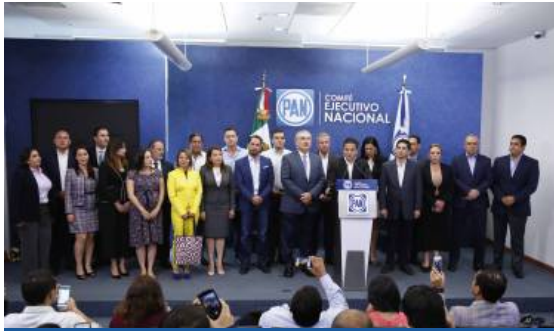
REUNIÓN PLENARIA 08-2018