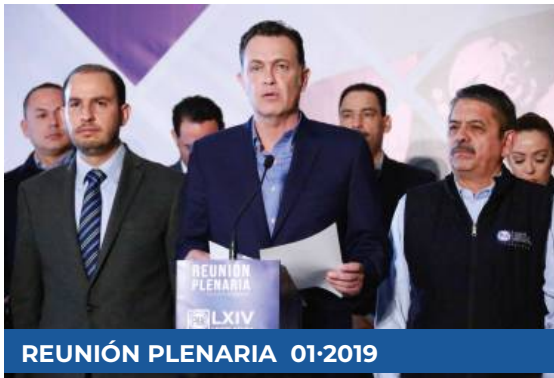
REUNIÓN PLENARIA 01-2019