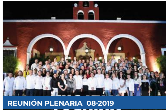
REUNIÓN PLENARIA 08-2019