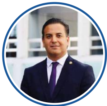
SEN. DAMIÁN ZEPEDA VIDALES COORDINADOR AGOSTO 2018- NOVIEMBRE 2018