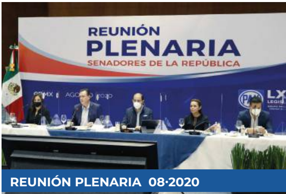
REUNIÓN PLENARIA 08-2020