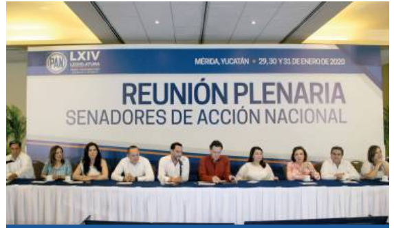
CONFERENCIA DE PRENSA