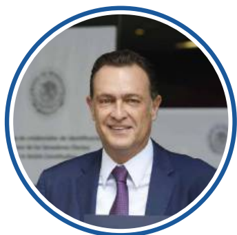
SEN. MAURICIO KURI GONZÁLEZ COORDINADOR ENERO 2019- FEBRERO 2021