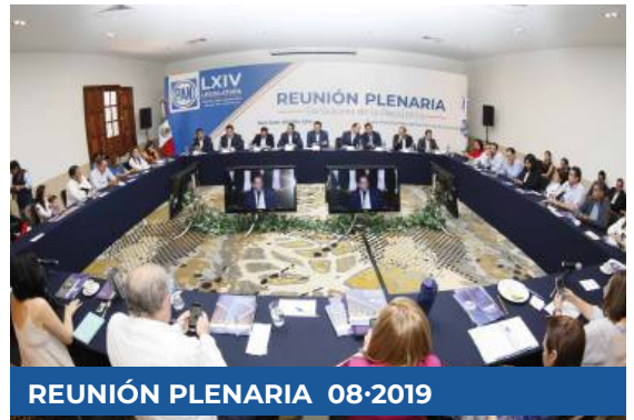
REUNIÓN PLENARIA 08-2019