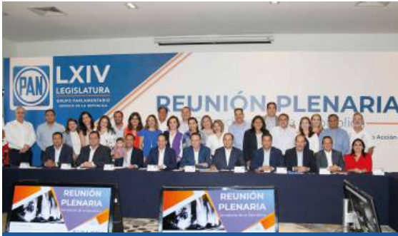
REUNIÓN PLENARIA 08-2019