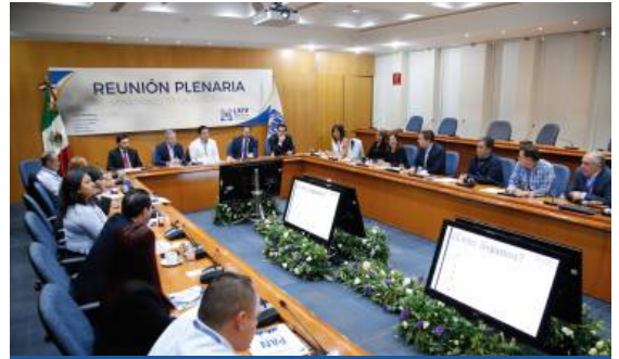
REUNIÓN PLENARIA 08-2018