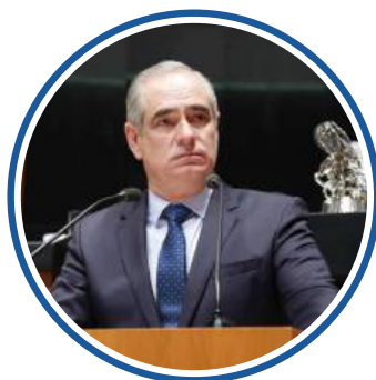
SEN. JULEN REMENTERÍA DEL PUERTO COORDINADOR ABRIL 2021