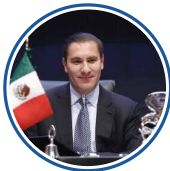
SEN. RAFAEL MORENO VALLE ROSAS † COORDINADOR NOVIEMBRE 2018- DICIEMBRE 2018